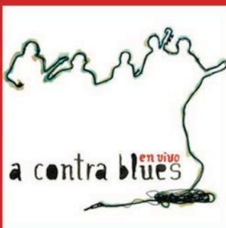
EN VIVO (2012)