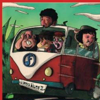
A CONTRA BLUES II (2010)