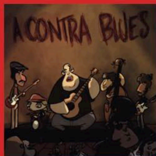
A CONTRA BLUES (2008)