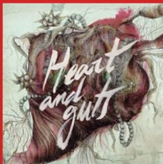
HEART AND GUTS (2017)