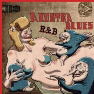
R&B. RAREZAS Y BLUES (2015)